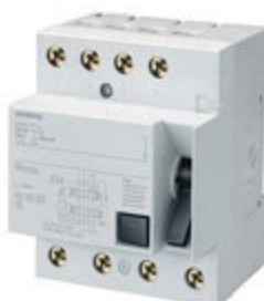
FI-Schutzschalter Typ B

Jeder Anschlusspunkt muss mit einer eigenen Fehlerstromschutzeinrichtung (RCD) geschützt sein (vgl. VDE 0100-722, Teil 7 „Stromversorgung von Elektrofahrzeugen“). In der Regel ist ein allstromsensitiver RCD Typ B erforderlich. Der Elektroinstallateur erteilt hierüber im konkreten Einzelfall Auskunft.